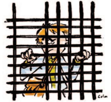
ÉVALUATION DES ENSEIGNANTS: LA GRILLE

Elles ouvrent la voie à toutes formes de pressions et s'inscrivent pleinement dans l'accompagnement permanent PPCR qui vise à transformer des enseignants titulaires en « stagiaires à vie » et à exercer sur eux une pression permanente ! ■